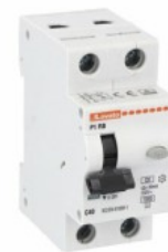
Wyłącznik różnicowonadprądowy P1 RB 1P+N 2 IEC