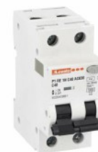
Residual current circuit breakers (RCCB) with overcurrent protection P1RE 1P+N 2 IEC