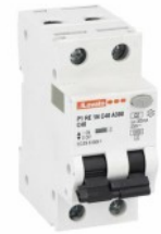
Residual current circuit breakers (RCCB) with overcurrent protection P1RE 1P+N 2 IEC