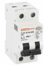
Residual current circuit breakers (RCCB) with overcurrent protection P1RE 1P+N 2 IEC