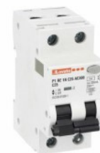
Residual current circuit breakers (RCCB) with overcurrent protection P1RE 1P+N 2 IEC