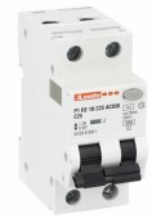
Residual current circuit breakers (RCCB) with overcurrent protection P1RE 1P+N 2 IEC