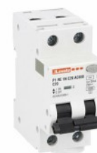
Residual current circuit breakers (RCCB) with overcurrent protection P1RE 1P+N 2 IEC