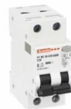
Residual current circuit breakers (RCCB) with overcurrent protection P1RE 1P+N 2 IEC