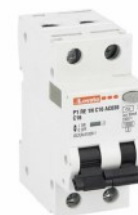
Residual current circuit breakers (RCCB) with overcurrent protection P1RE 1P+N 2 IEC