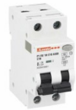
Residual current circuit breakers (RCCB) with overcurrent protection P1RE 1P+N 2 IEC