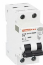
Residual current circuit breakers (RCCB) with overcurrent protection P1RE 1P+N 2 IEC