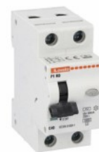
Interruttore magnetotermico differenziale monoblocco P1 RB 1P+N 2 IEC