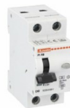
Interruttore magnetotermico differenziale monoblocco P1 RB 1P+N 2 IEC