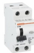
Interruttore magnetotermico differenziale monoblocco P1 RB 1P+N 2 IEC