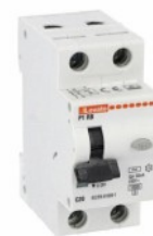
Interruttore magnetotermico differenziale monoblocco