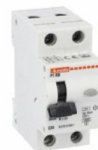
Interruttore magnetotermico differenziale monoblocco P1 RB 1P+N 2 IEC