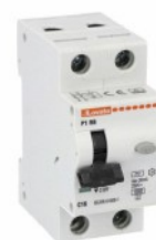
Interruttore magnetotermico differenziale monoblocco P1 RB 1P+N 2 IEC