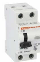
Interruttore magnetotermico differenziale monoblocco P1 RB 1P+N 2 IEC