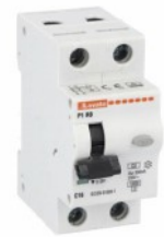
Interruttore magnetotermico differenziale monoblocco