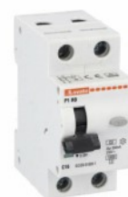
Interruttore magnetotermico differenziale monoblocco P1 RB 1P+N 2 IEC