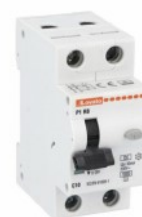
Interruttore magnetotermico differenziale monoblocco