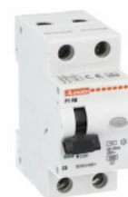
Interruttore magnetotermico differenziale monoblocco