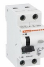
Interruttore magnetotermico differenziale monoblocco