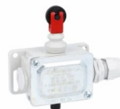
Piston de împingere al rolei de sus PLN...R