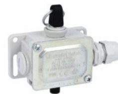
Pârghie de tragere cu frânghie fără buton de resetare PLNU1ATW