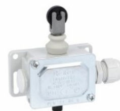
Piston de împingere al rolei de sus PLN...R