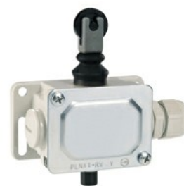
Piston de împingere al rolei de sus PLN...R