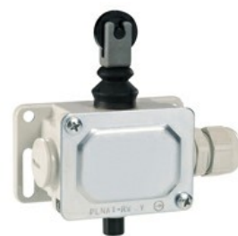
Piston de împingere al rolei de sus PLN...R