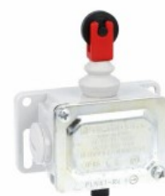
Piston de împingere al rolei de sus PLN...R