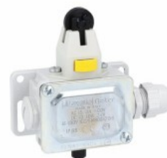
Încuietoare și eliberare manuală - Pistonul de împingere al rolei de sus PLNA1RAGW