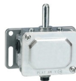
Înfășurare manuală cu eliberare magnetică - tip stâlp PLA1AMW