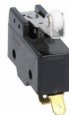
Maneta de împingere centrală a rolei KSC3