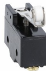
Maneta de împingere centrală a rolei KSC2