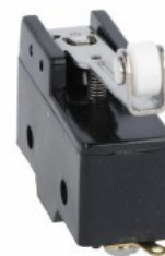
Maneta de împingere centrală a rolei KSC2