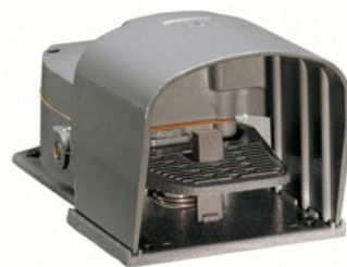
O pedală, cu pârghie de siguranță în două trepte - cu capac KR211