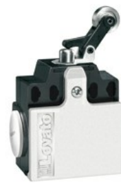
Pârghie de împingere laterală a rolei KND