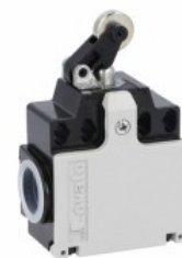
Maneta de împingere centrală a rolei KNC