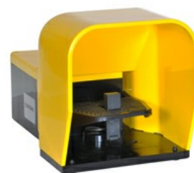
O pedala, cu maneta de siguranta - cu capac KG210