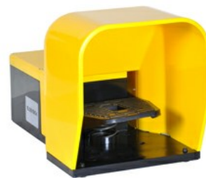
O pedala, cu actionare libera - cu capac KG200