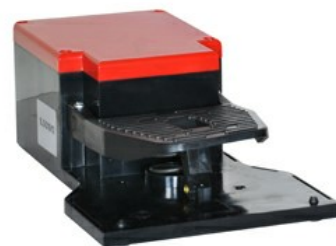
O pedală, cu blocare a actuatoarei pedalei - deschisă KG120