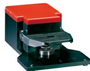
O pedală, cu acționare liberă - deschisă KG100