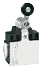
Piston cu pârghie cu role KCE