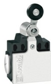
Piston cu pârghie cu role KCE