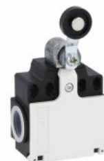
Piston cu pârghie cu role KCE