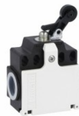
Pârghie de împingere laterală a rolei KCD