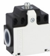
Piston superior tijeii de împingere KCA