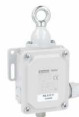
Rope-pull lever without reset button P2L