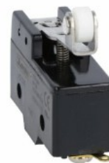
Dźwignia z rolką wciskaną centralnie KSC3