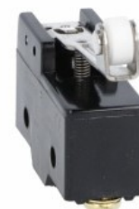
Dźwignia z rolką wciskaną centralnie KSC2