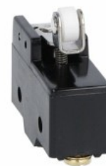
Dźwignia z rolką wciskaną centralnie KSC1